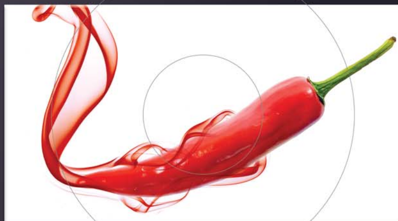
ΜΕΤΑΛΛΙΚΟ ΠΑΝΕΛ Real Pepper