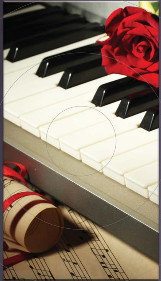
ΜΕΤΑΛΛΙΚΟ ΠΑΝΕΛ Piano Lover

Δεν είναι ορατή στο ανθρώπινο μάτι και έχει ευεργετικές ιδιότητες για την υγεία του ανθρώπου καθώς χρησιμοποιείται, εδώ και δεκαετίες, σε ιατρικές εφαρμογές, ακόμα και στις θερμοκοιτίδες των εμβρύων.