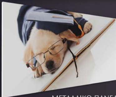
ΜΕΤΑΛΛΙΚΟ ΠΑΝΕΛ Hyper Dog

Η επιφάνεια του χώρου που μπορεί να καλυφθεί από ένα Πάνελ εξαρτάται από τις συνθήκες του χώρου (γεωγραφική θέση, μόνωση, απώλειες, χωροθέτηση, εμπόδια).