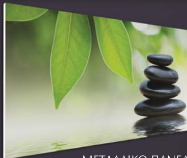
ΜΕΤΑΛΛΙΚΟ ΠΑΝΕΛ Aura