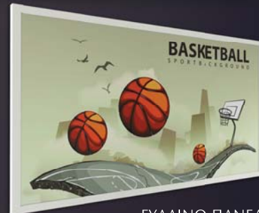
ΓΥΑΛΙΝΟ ΠΑΝΕΛ BasketAll